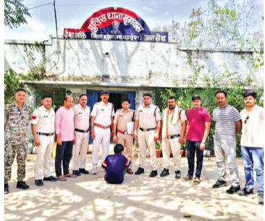
हरिभूमि न्यूज गुना