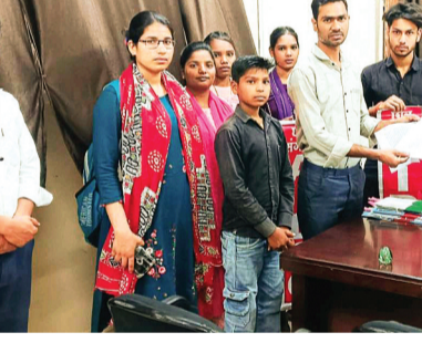
का काम आसान हो जाए, जिसका खासियाजा गरीब और मध्यम परिवार के छात्रों पर होगा और वे छात्र पढ़ाई से वंचित हो जाएंगे। इसलिए सरकार को तुरंत शिक्षकों की मांगों पर विचार कर इस नियम को रद्द करना चाहिए।