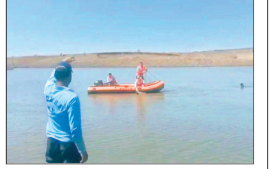
हरिभूमि न्यूज | चाचौड़ा

बुझ गया घर का इकलौता चिराग तालाब में डूबने से 13 वर्षीय बालक की मौत एनडीआरएफ ने रेस्क्यू कर निकाला शव